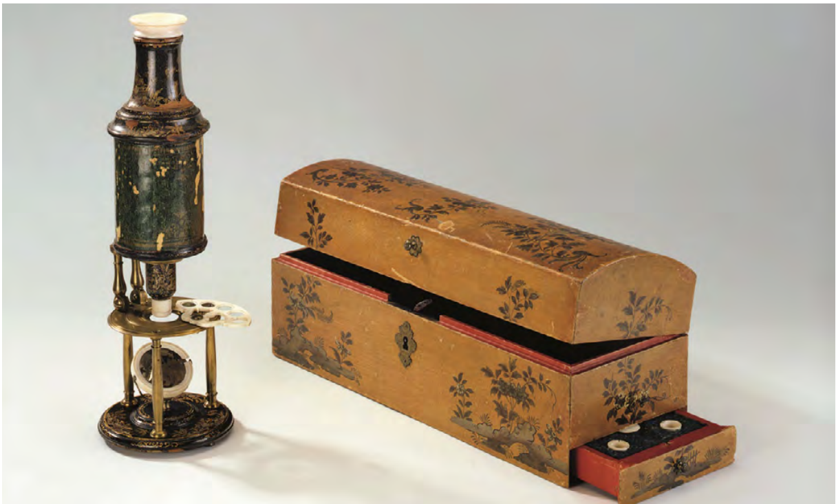
FIGURA 3 – MICROSCÓPIO DE CHARLES BONNET (DOADO POR HORACE-BÉNÉDICTE DE SAUSSURE), ATRIBUÍDO A J.-A. NOLLET. FEITO DE MADEIRA, VIDRO, LATÃO, METAL E VERNIZ MARTIN

FONTE: Museu de História das Ciências, Genebra, Suíça.