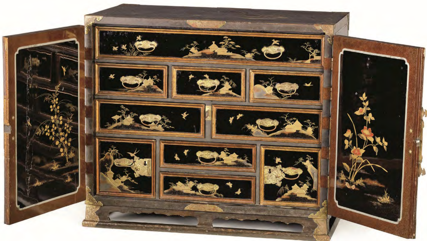
FIGURA 5 – GABINETE LAQUEADO, FIM DO SÉCULO XVII, JAPÃO, MADEIRA LAQUEADA, 91 X 80 X 50 CM