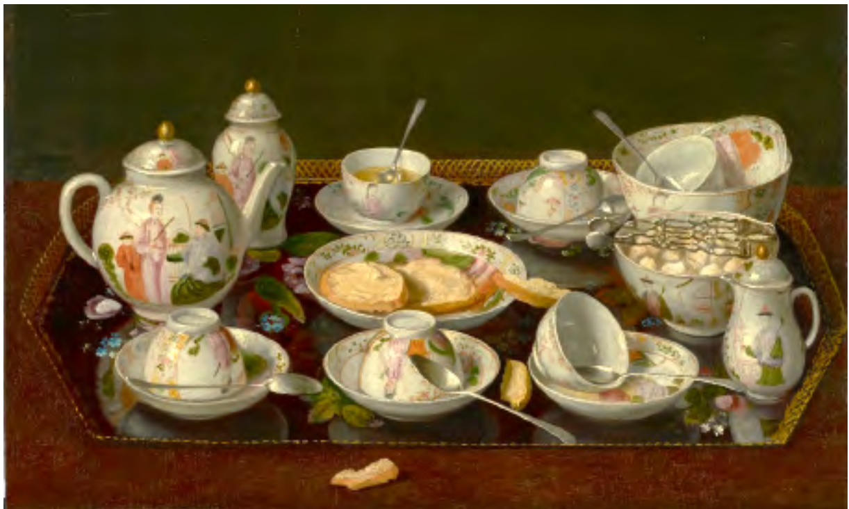
FIGURA 4 - JEAN-ETIENNE LIOTARD (SUÍÇA, 1702-1789). NATUREZA MORTA COM SERVIÇO DE CHÁ , C. 1781-1783. ÓLEO SOBRE TELA MONTADO SOBRE MADEIRA, 35,8 X 51,6CM