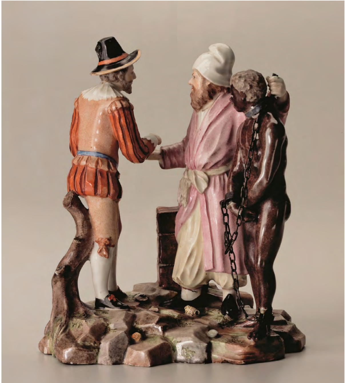
FIGURA 6 – OS OFÍCIOS DOS HOMENS, C. 1775, PORCELANA PINTADA DE CORES VIVAS, OFICINA DE PORCELANA KILCHBERG-SCHOOREN, 19 CM

FONTE: Museu Nacional Suíço, Zurique, Suíça (n. inv. HA 74 11.3.1903).