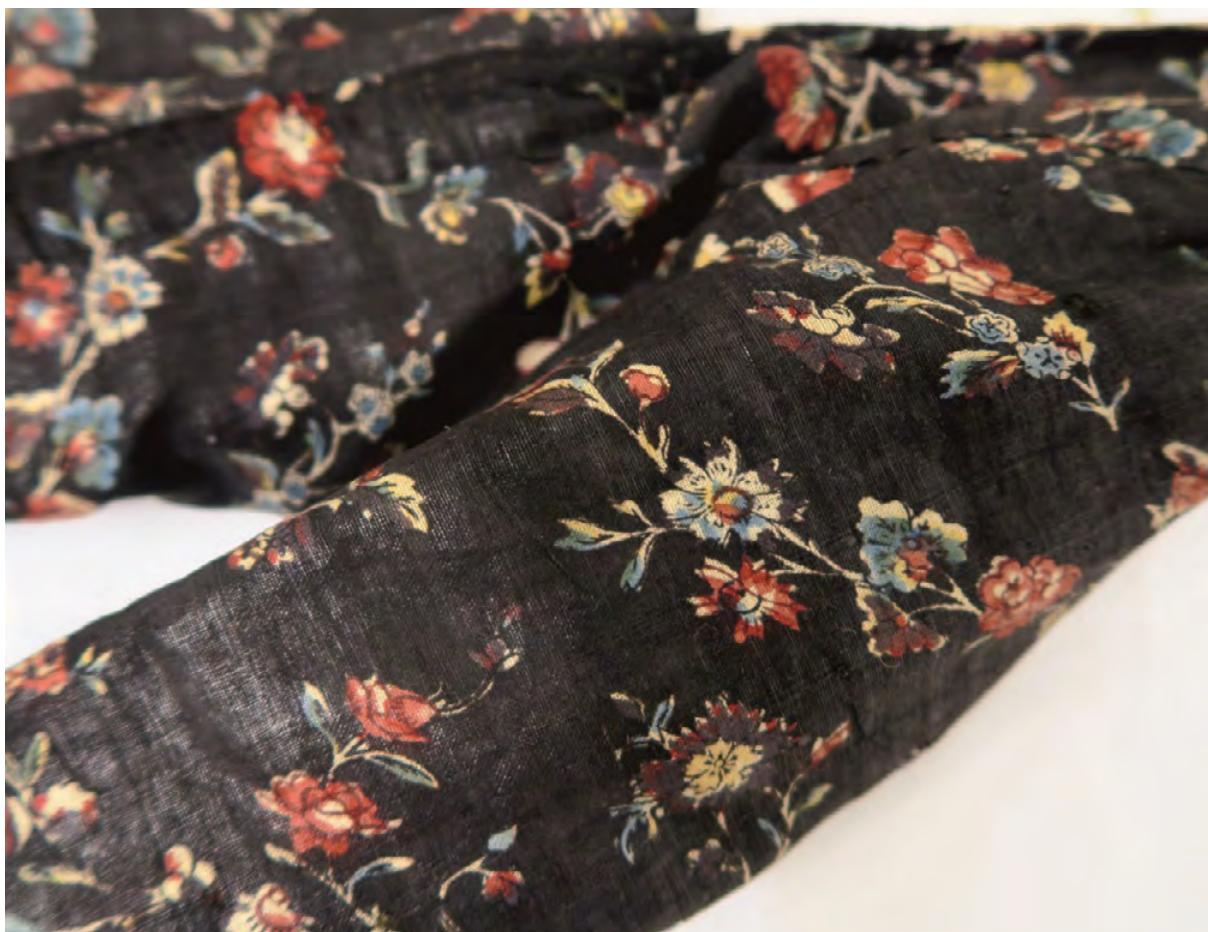
FIGURA 7 – CASACO FEMININO EM TECIDO PRETO IMPRESSO COM MOTIVOS FLORAIS, C. 1770, DE ALGODÃO E LÃ