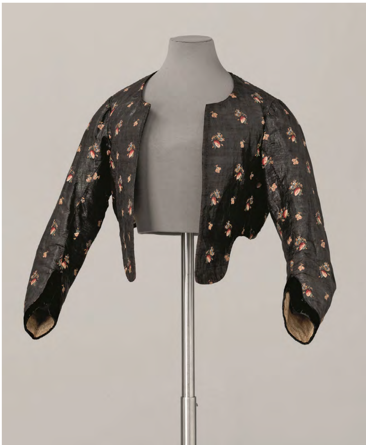
FIGURA 8 – CASACO FEMININO EM CASTANHO ESCURO COM MOTIVOS FLORAIS, ACABAMENTO DAS MANGAS EM VELUDO, 40 X 38 CM