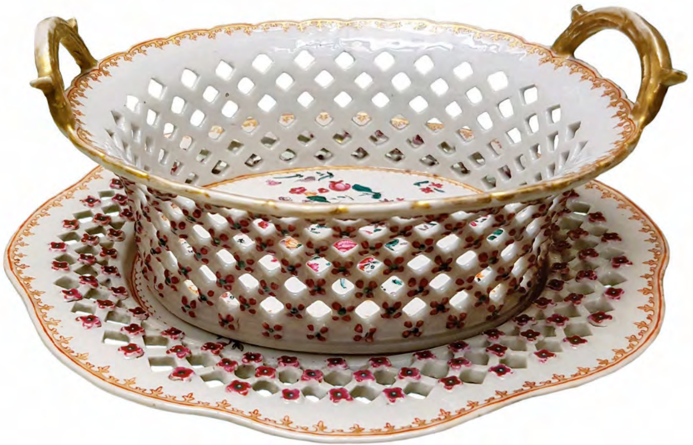
FIGURA 1 - CESTA COM PIRES, C. 1760/1770. PORCELANA PINTADA DA COMPANHIA DAS ÍNDIAS, CHINA, 21,6 CM (COMPRIMENTO DA BASE).